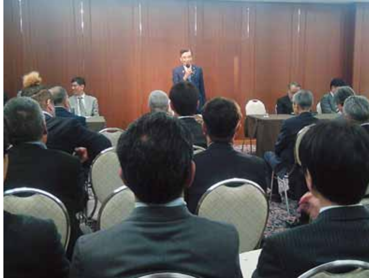
全東京記章商工協総会の様子