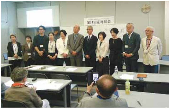
選出された役員と総会の様子